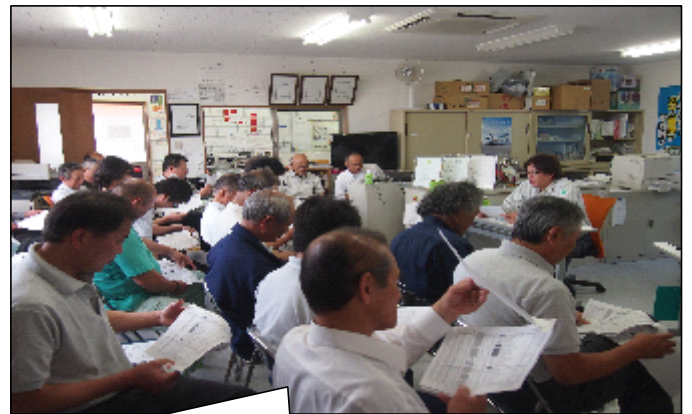
「もしも事故が起こったら」 by 堀内部長