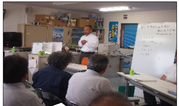
「より一層の安全予防と安全運転を」 by 成瀬部長