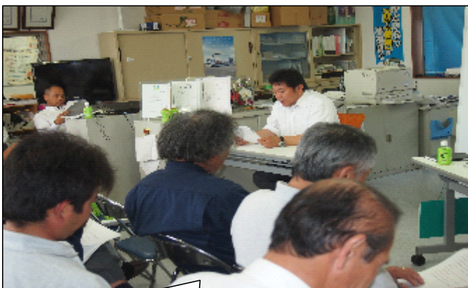
「三大疾病とその予防の食事」 by 千田部長