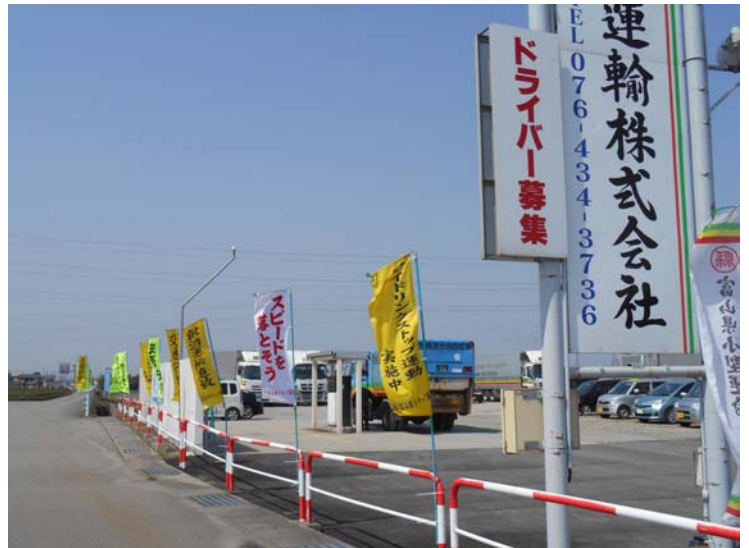
道路には交通安全の旗