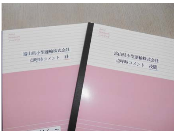
点呼時にドライバー一人一人にその日の体調や安全運転に対する気持ちを伺う