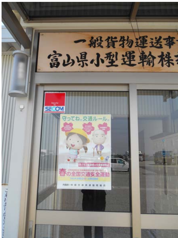
玄関に交通安全のポスター